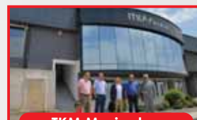
TKM Music doo