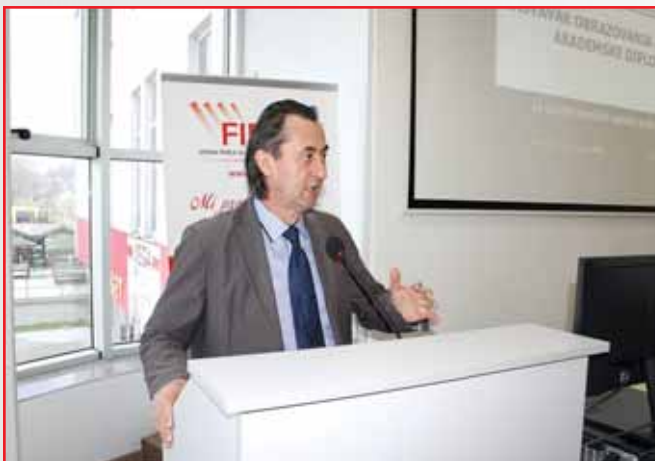
Prof.dr. Kadija Hodžić tokom predavanja učenicima srednjih škola prilikom njihove posjete Visoke škole FINRa na temu: "Nastavak obrazovanja i sticanje akademske diplome".