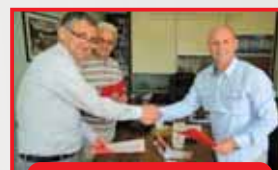
TMD Dommers Lightning doo