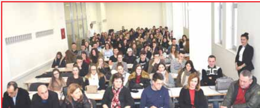
Učenici srednjih škola u amfiteatru Visoke škole FINra