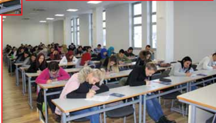
Studenti Visoke škole za finansije i računovodstvo FINra Tuzla akademske 2019/2020.