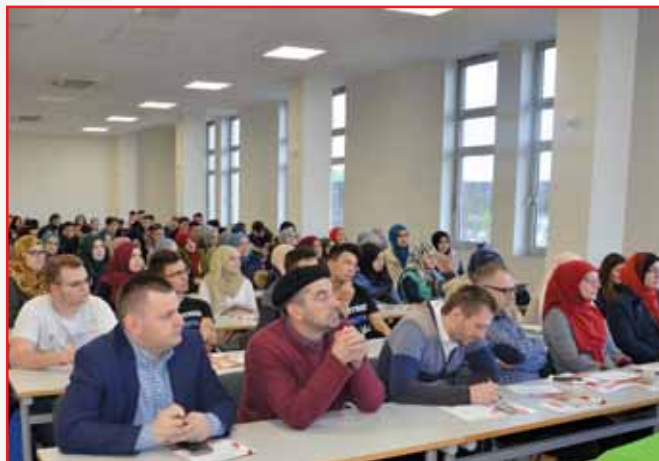
Učenci i profesori Behrambegove medrese..