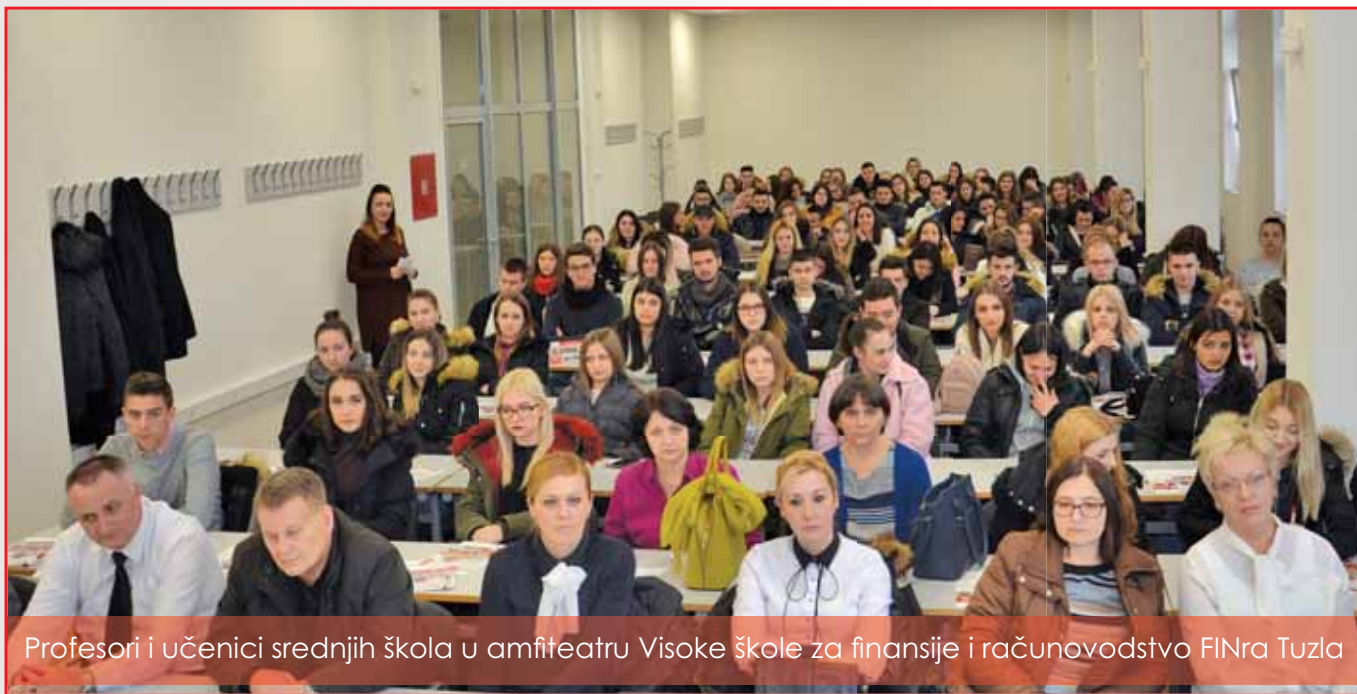
Profesori i učenici srednjih škola u amfiteatru Visoke škole za finansije i računovodstvo FINRa Tuzla