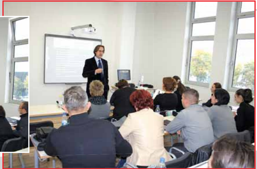
Predavanja prof. dr. Kadrije Hodžića

Kao nastavno sredstvo se koristi Smart Board - „pametna“ tabla posljednje generacije. Predavanja i vježbe koje se realizuju uz pomoć „pametne“ table se spremaju u datoteke u SMART Notebook™, koji je dostupan studentima, i nakon završetka predavanja, na njihovim pametnim telefonima, tabletima ili računarima. Također, od posebne je važnosti za studente koji nisu prisustvovali nastavi jeste da putem e-maila dobiju sve što je profesor ili asistent radio na "pametnoj" tabli. Jednom napravljena prezentacija se može koristiti više puta, ali isto tako po potrebi mijenjati i dopunjavati.