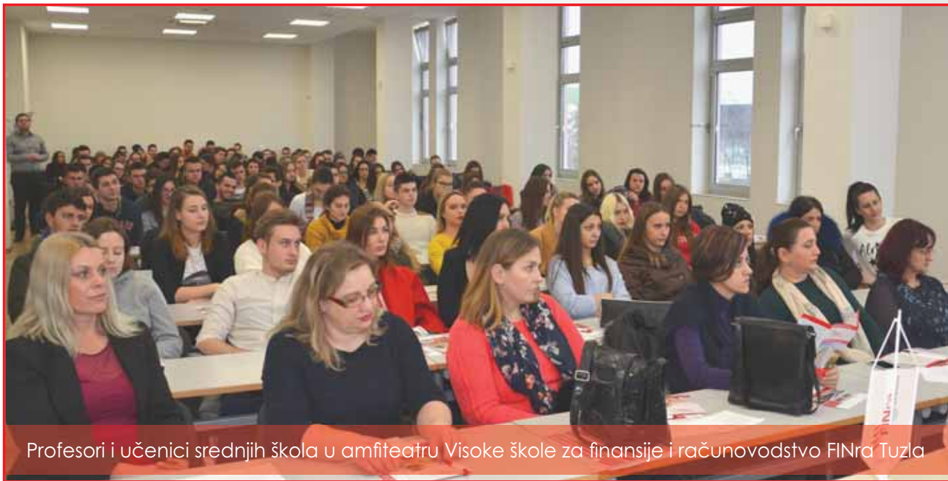
Profesori i učenici srednjih škola u amfiteatru Visoke škole za finansije i računovodstvo FINra Tuzla