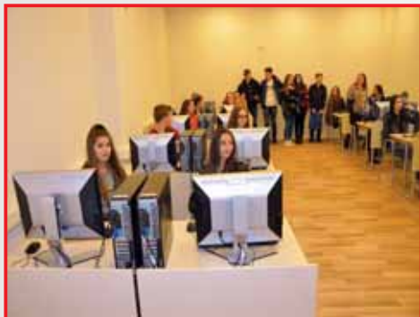
Učenici srednjih škola u učionici za praktičnu nastavu

Prigodnim predavanjem na temu "Nastavak obrazovanja i sticanje akademske diplome" učenicima se obratio Prof.dr. Kadrija Hodžić, jedan od profesora na Visokoj školi FINra. Ovom temom se želi ukazati na koristi od sticanja akademske diplome, a što će učenicima završnih razreda biti „vjetar u leđa“ da u svojoj profesionalnoj orijentaciji nastave studirati i naprave pravi izbor.